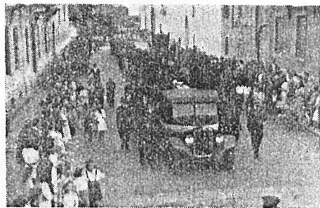
Onoranze ai patrioti caduti