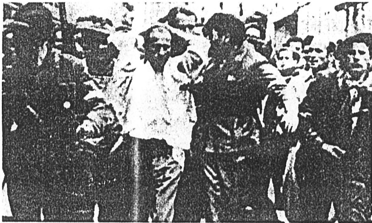
25 aprile '45. Riconosciuto un ex milite delle Brigate Nere viene condotto dai partigiani in una prigione del popolo. È iniziata l'epurazione.

Diciotto mesi di guerra civile fra italiani finita in un bagno di sangue hanno lasciato aperte molte ferite. Ecco come vissero quei giorni gli uomini fedeli fino all'ultimo al duce